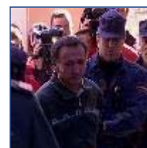
La juez registra Santiagu