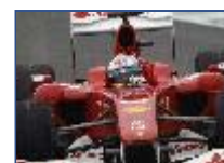
Fernanc piloto m