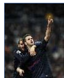
Olympic Giron di su rivali domésti